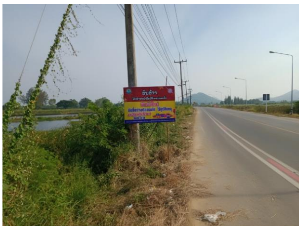
ทางโค้ง หมู่ ๔ บ้านหนองบัว